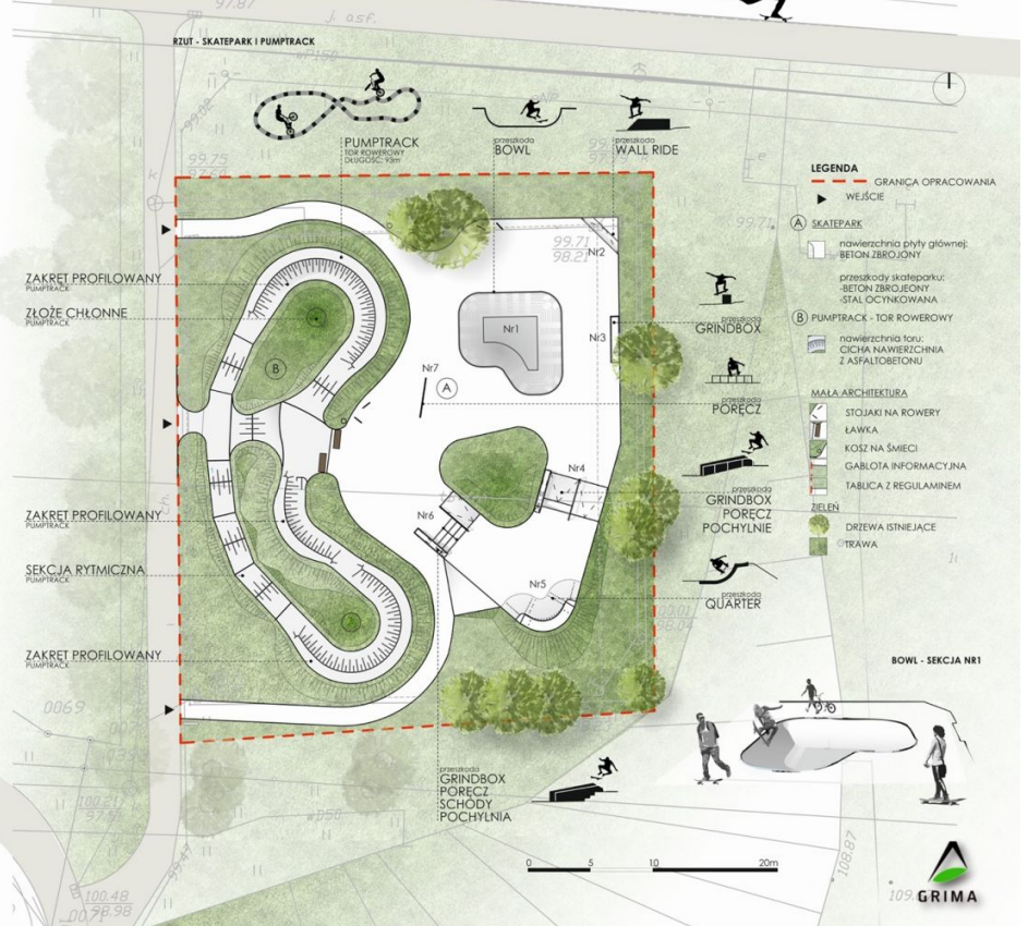
Projekt skateparku z 2019 roku

Zdaniem specjalistów od budowy tego typu konstrukcji kwota, jaką przeznaczyło na ten cel miasto, jest zdecydowanie za mała, a inwestycja powinna zostać podzielona na dwa etapy.